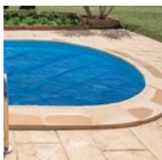
Cubierta isotérmica Isothermic cover CVPE700