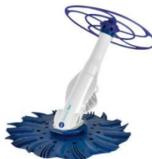
Limpiafondos automático Automatic cleaner 90397