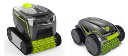
Robot Robot GT3220/GV3420